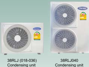
38RLJ (018-036) Condensing unit