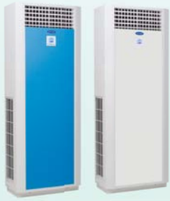
▲ 40QBJ Series

The latest innovation from the world leader in air conditioning, Carrier, introduces the all-new floor standing split air conditioning system. The 40QBJ millennium design, inside and out, will provide you with cool comfort via a variety of control functions.