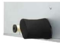
ฝาครอบท่อก๊าซและท่อของเหลว (บรรจุในกล่องพร้อมผลิตภัณฑ์ทั้ง 2 ด้าน)

สามารถเลือกติดตั้งได้ทั้งซ้ายและขวา เมื่อเลือกใช้งานด้านใด ด้านหนึ่งให้ดึงฝาครอบท่อก๊าซ และท่อของเหลวที่ใช้งานด้านนั้นออก จากนั้นให้ถอดแผ่นกันรั่วก่อนทำการเชื่อมต่อ