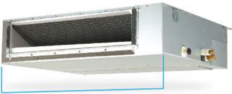
70cm* *รุ่น FDBF13/18DV2S

ออกแบบคอยล์เย็นให้มีความกว้างที่พอดีกับโถงทางเดินในห้อง