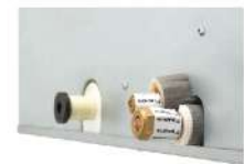
แผ่นกันรั่ว (เพิ่มกับท่อก๊าซและท่อของเหลวทั้ง 4 จุด)

เหมาะสำหรับโรงแรม, คอนโดมิเนียม เลือกเชื่อมต่อได้จากทั้งฝั่งซ้าย และขวา ดีไซน์ที่เน้นความบางและความเงียบ